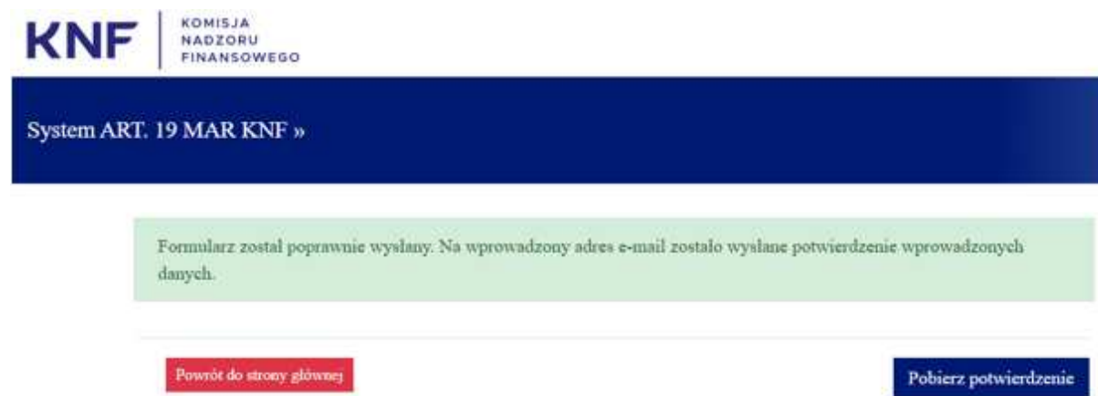
Rysunek 7. Potwierdzenia przesłania formularza

Wysłane dane powiadomienia trafiają do rejestru wewnętrznego UKNF. Na adres e-mail użytkownik otrzyma potwierdzenie wprowadzonych danych w postaci pliku pdf, które można również pobrać bezpośrednio ze strony: