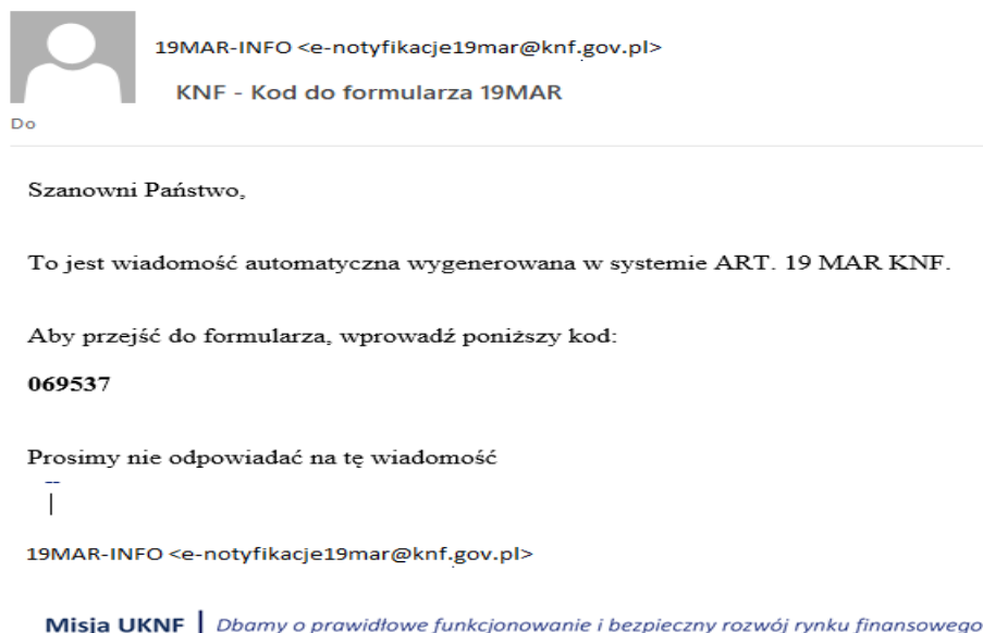
Rysunek 2. Wiadomość e-mail z kodem do formularza

Następnie w kolejnym kroku należy wpisać kod, którego potwierdzenie przekierowuje do strony z formularzem.