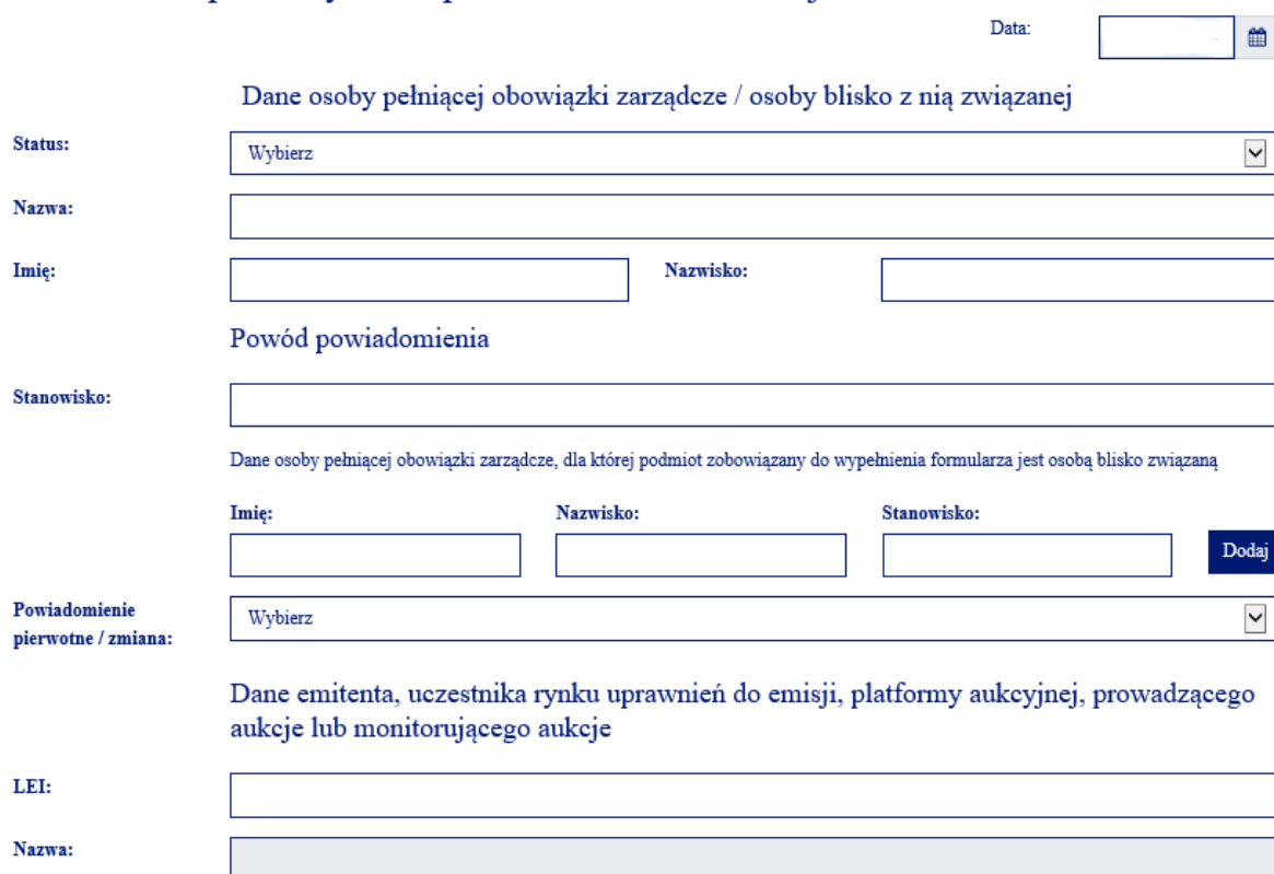
Rysunek 3. Dane podstawowe powiadomienia