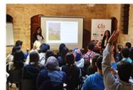
Organizacja warsztatów i wykładów