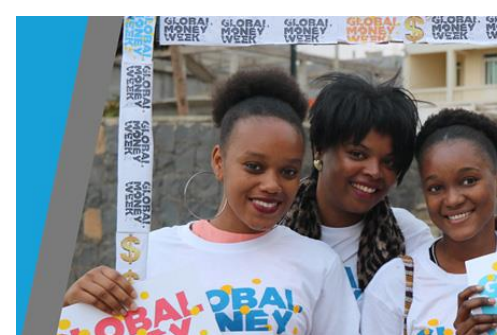
GMW Pre-Form 2019