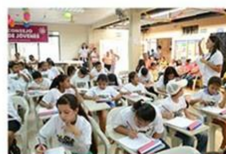
Gazetki szkolne i audycje emitowane przez szkolny radiowęzeł