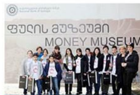
Wycieczki do muzeów pieniądza