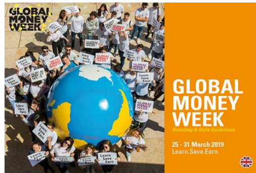
GMW Branding & Style Guidelines