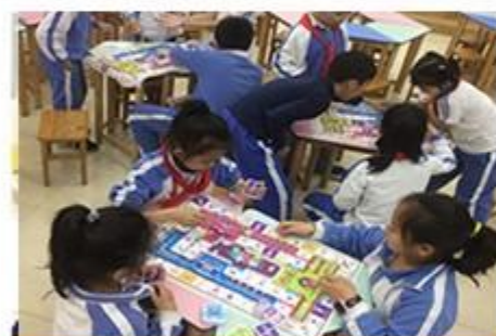
Gry i zabawy o tematyce finansowe