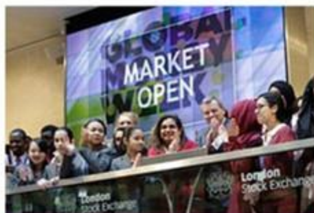
Wycieczki na giełdy papierów wartościowych

Oto kilka przykładów, które mogą Cię zainspirować!