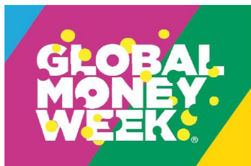
GMW Logos & Designs