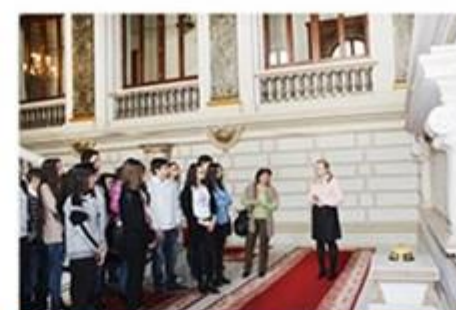
Wizyty w szkołach i na uczelniach wyższych