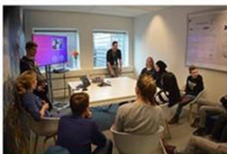
Spotkania z przedsiębiorcami oraz osobami łączącymi pracę zawodową z pasją