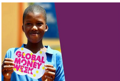
GMW Print Pack: Printable Promotional Resources