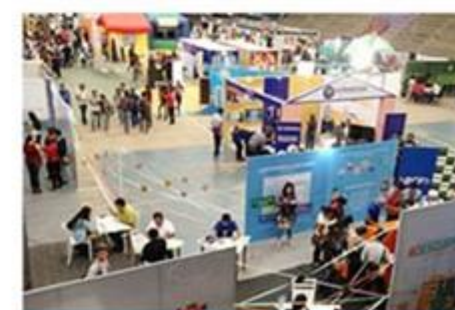
Organizacja targów i kiermaszy edukacyjnych