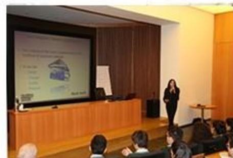
Prezentacje multimedialne, pokazy filmów