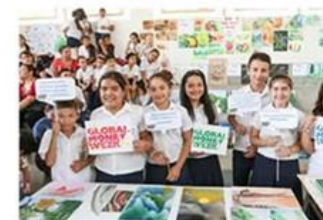
Organizacja konkursów plastycznych, fotograficznych i literackich