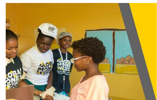
GMW Post-Form 2019

| Wszystkie materiały pomocnicze są dostępne online w sekcji 'Resources' na www.globalmoneyweek.org