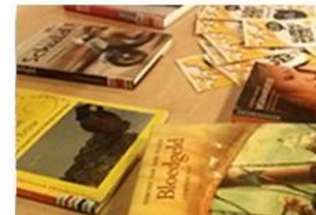
Wizyty w bibliotekach